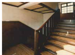
▲ 昭和50～60年代の旧山下小学校階段

横浜市立学校の木造校舎としては最後まで使用されて唯一現存しており、県内でも戦中期の木造校舎としては唯一現存する貴重な歴史的建造物です。特に木造階段は、建設当時のオリジナルのまま残されており、躯体(建物の骨組みなどの構造体)部分にも建設当時の部材が残っています。また、校門の門柱や門扉も廃校前のものが現存し、小学校の面影を残しています。