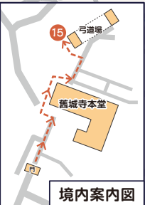
※境内に弓道場がありますのでご注意ください。