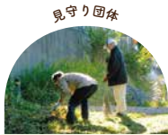
緑区遺産三保町保存会

16 先人たちが食糧確保のために人力で水源工事を行い、生活していたことを教えてくれる建造物です。訪問者に安全に、いしえを偲んでいただけるよう、四半期ごとに担当グループで草刈りと清掃作業を行い、維持管理しています。